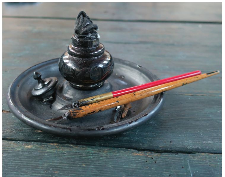
Pen en inkt